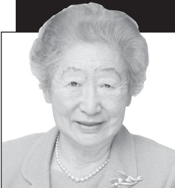
緒方貞子氏 SADAKO OGATA

第8代国連難民高等弁務官。東京都生まれ。外交官を父にもち、11歳までアメリカ、中国で過ごした。聖心女子大学を卒業後、アメリカに留学し、カリフォルニア州立大学で学位を取得。1968年に国連総会の政府代表顧問、上智大学教授、国連大使を経て、78年にユニセフ(国連児童基金)議長に就任し、79年の「国際児童年」事業を推進した。82～85年国連人権委員会日本代表、91年(平成3)1月に国連難民高等弁務官に就任した(～2000)。就任早々、湾岸戦争でのクルド人難民問題に直面、積極的救済努力を説いて回った。旧ユーゴスラビアやソマリアをはじめ、2000万人にものぼる世界の難民を生んでいる紛争地帯を飛び回る行動力と、紛争当事者を相手に回してのタフ・ネゴシエーターぶりなどに、各国外交団の評価は高い。96年ユネスコ平和賞受賞。上智大学名誉教授。2001年文化功労者。2003年独立行政法人国際協力機構(JICA(ジャイカ))理事長就任。同年文化勲章受章。曾祖父は元内閣総理大臣犬養毅。