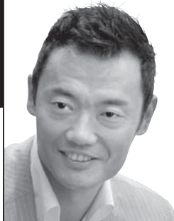
中田 宏氏 HIROSHI NAKADA

第8代国連難民高等弁務官。東京都生まれ。外交官を父にもち、11歳までアメリカ、中国で過ごした。聖心女子大学を卒業後、アメリカに留学し、カリフォルニア州立大学で学位を取得。1968年に国連総会の政府代表顧問、上智大学教授、国連大使を経て、78年にユニセフ(国連児童基金)議長に就任し、79年の「国際児童年」事業を推進した。82～85年国連人権委員会日本代表、91年(平成3)1月に国連難民高等弁務官に就任した(～2000)。就任早々、湾岸戦争でのクルド人難民問題に直面、積極的救済努力を説いて回った。旧ユーゴスラビアやソマリアをはじめ、2000万人にものぼる世界の難民を生んでいる紛争地帯を飛び回る行動力と、紛争当事者を相手に回してのタフ・ネゴシエーターぶりなどに、各国外交団の評価は高い。96年ユネスコ平和賞受賞。上智大学名誉教授。2001年文化功労者。2003年独立行政法人国際協力機構(JICA(ジャイカ))理事長就任。同年文化勲章受章。曾祖父は元内閣総理大臣犬養毅。